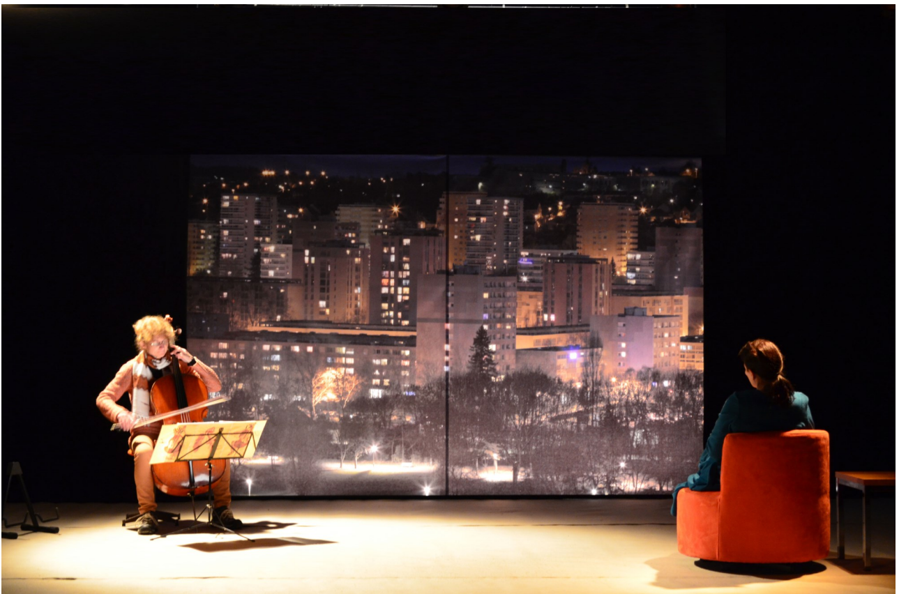
Photo prise lors d'une répétition à l'Abreuvoir