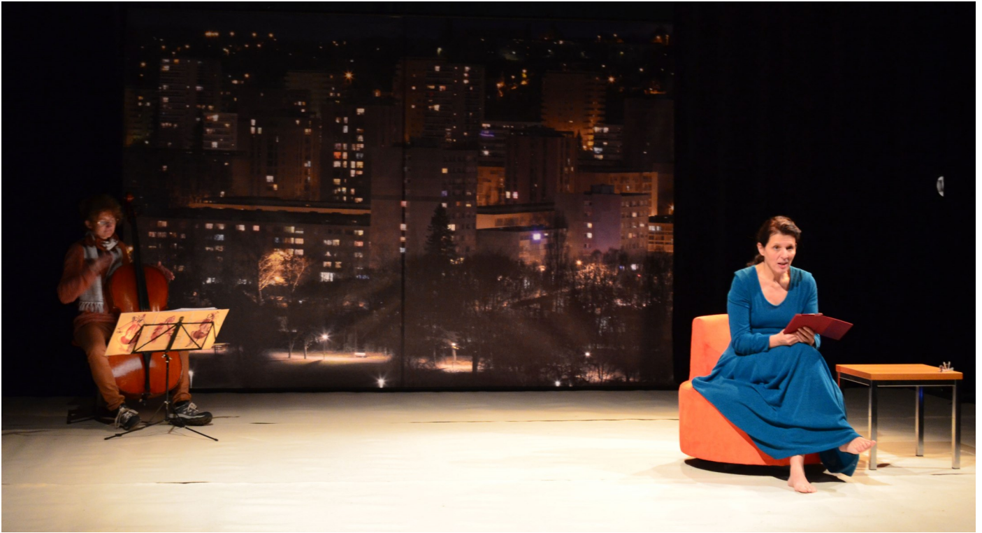
Photo prise lors d'une répétition à l'Abreuvoir